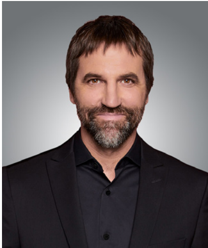
L'honorable Steven Guilbeault Ministre de l'Environnement et du Changement climatique

En tant que ministre responsable de l'Agence Parcs Canada, je suis ravi de vous faire part des progrès réalisés par Parcs Canada dans divers domaines liés à la Table ronde du ministre 2020 sur Parcs Canada.