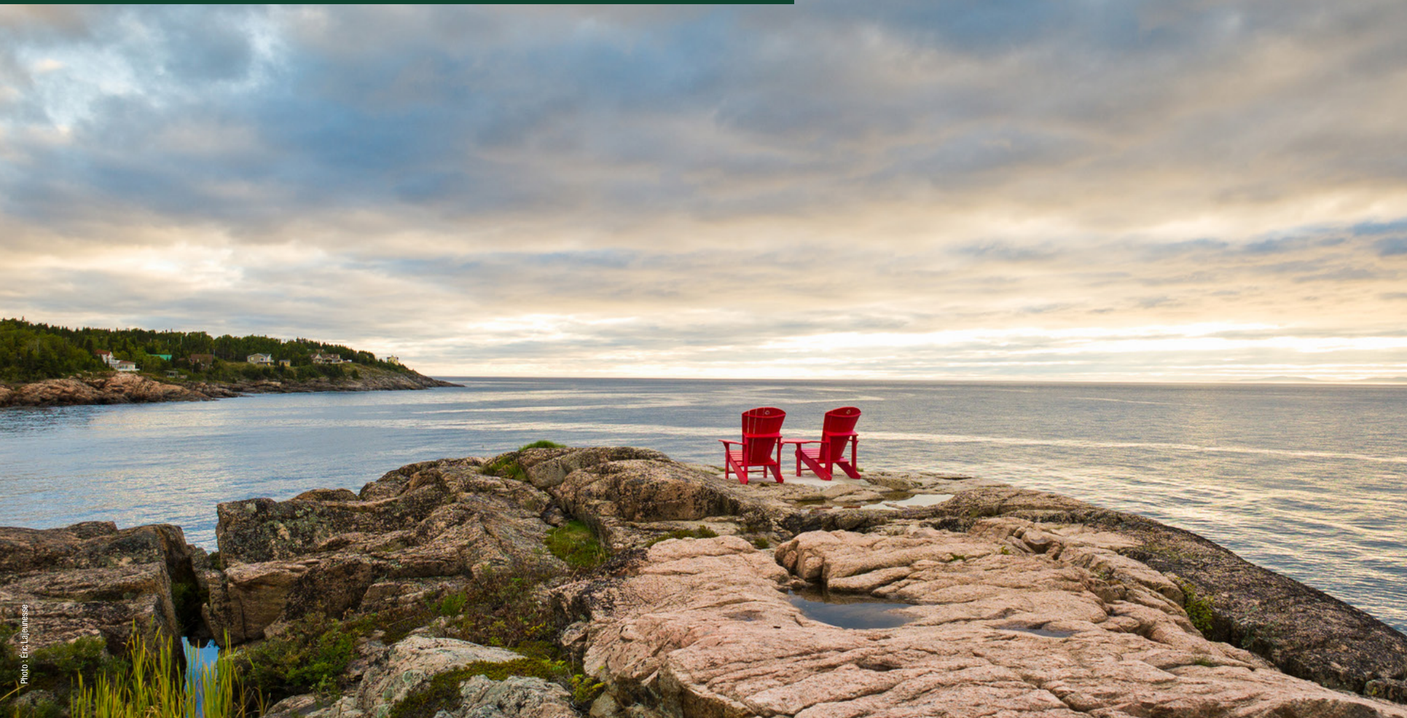
Table ronde du ministre sur Parcs Canada 2020