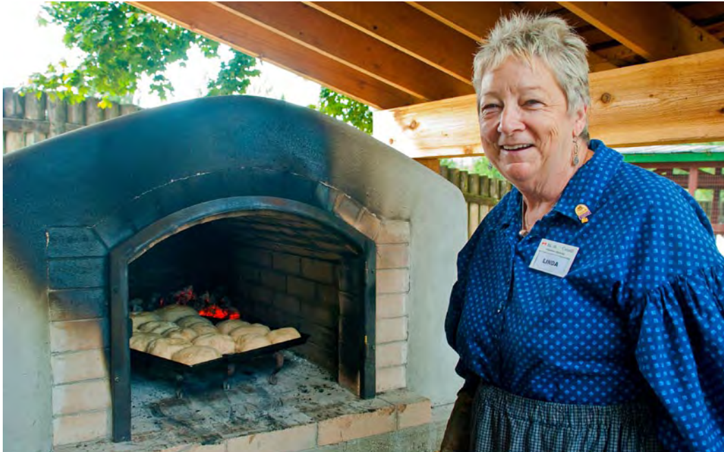
Bénévole au LHNC du Fort-Langley Parcs Canada/N. Hildebrand 2011