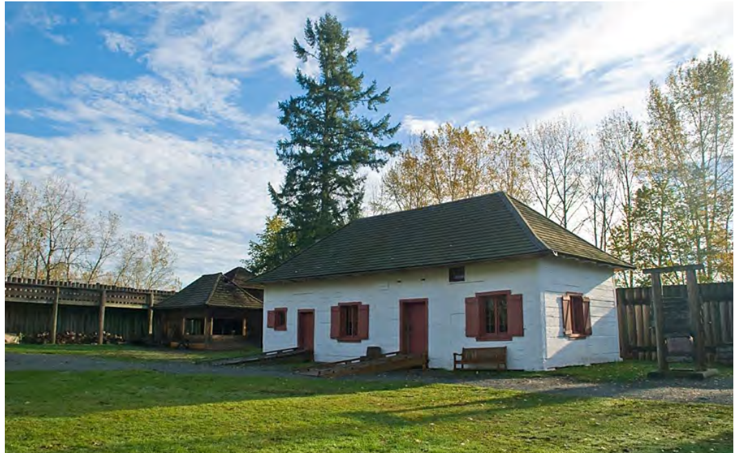
L'entrepôt. Parcs Canada/N. Hildebrand 2010