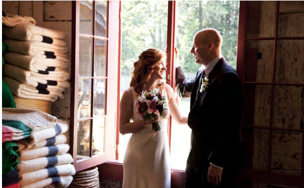
Cérémonie de mariage au LNH du Fort-Langley