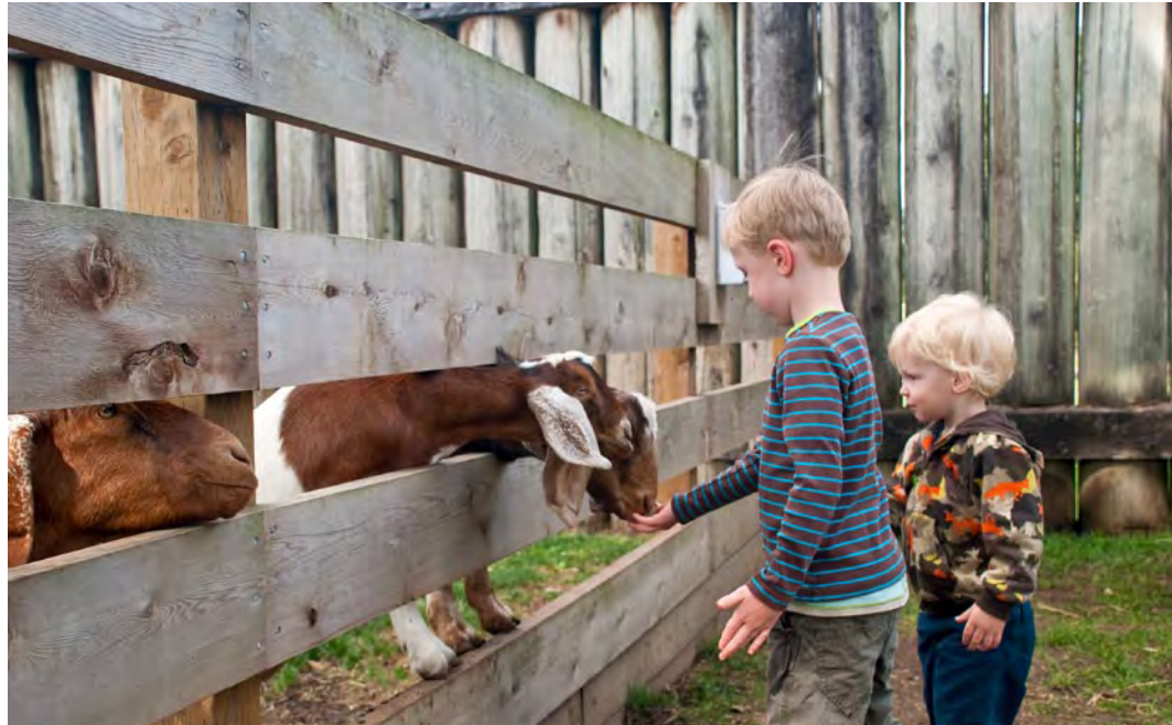
Parcs Canada/N. Hildebrand 2010