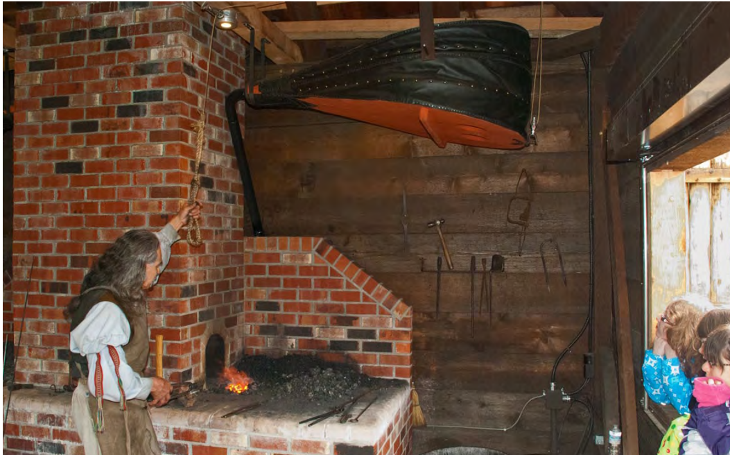
Démonstration à la forge Parcs Canada 2011