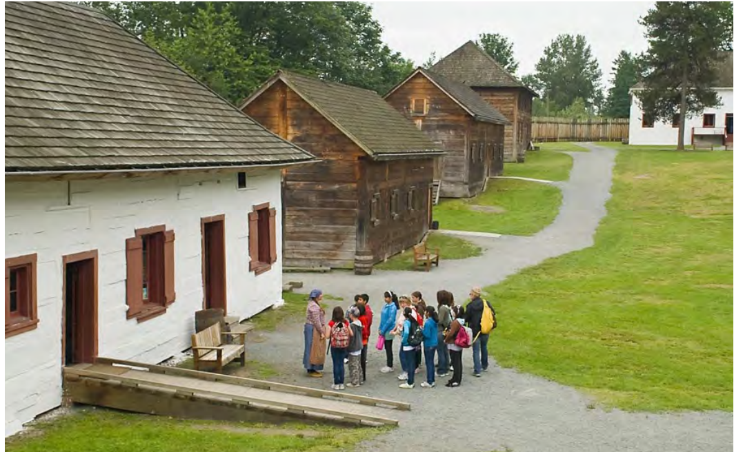
Excursion scolaire au LHNC du Fort-Langley Parcs Canada/N. Hildebrand 2011