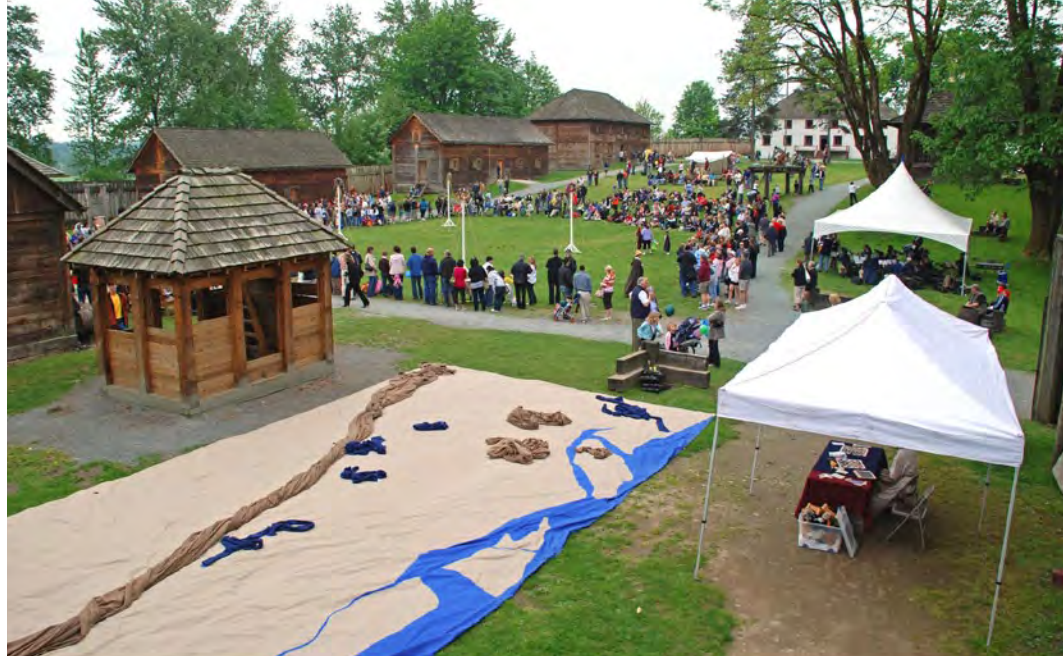
Fête de Victoria au LHNC du Fort-Langley Parcs Canada/N. Hildebrand 2008