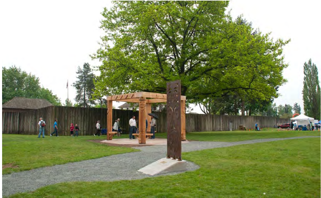
À l'extérieur de la palissade Parcs Canada/N.Hildebrand 2009