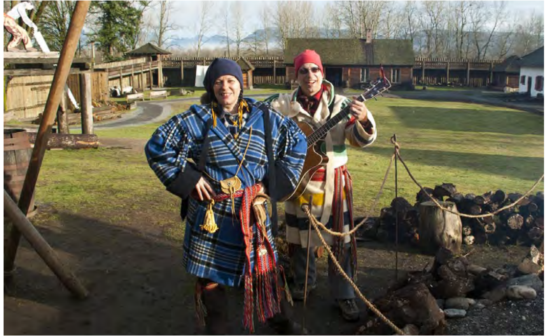
Vive les voyageurs Parcs Canada/N. Hildebrand 2011