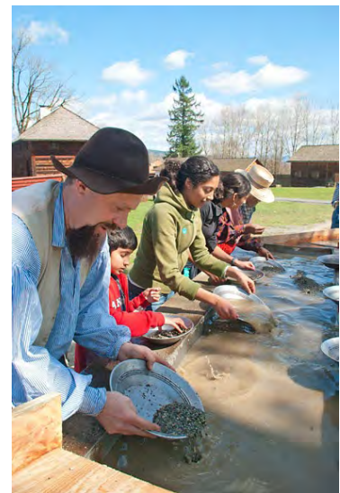
Lavage de l'or à la batée Parcs Canada/N. Hildebrand 2011