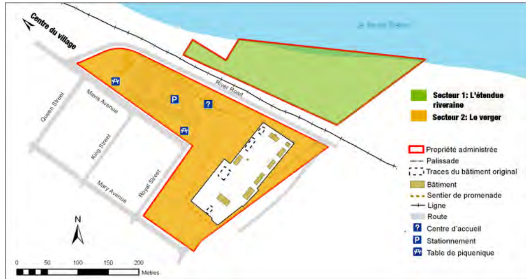
Figure 3 : Carte illustrant les zones visées par les démarches de gestion sectorielle