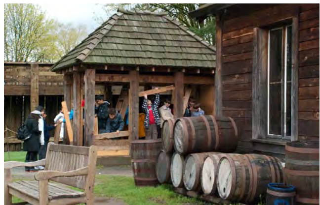
Parcs Canada 2011