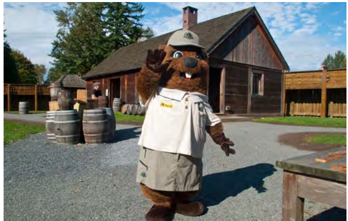
Parka au LHNC du Fort-Langley Parcs Canada/N. Hildebrand 2011

Le présent chapitre décrit en détail les objectifs énoncés précédemment, dans le cadre d'une stratégie de mise en œuvre étalée sur cinq ans. Le tableau ci-dessous présente les objectifs et les responsabilités pour les cibles et les mesures mises en œuvre pour chacune des stratégies maîtresses et des démarches de gestion sectorielle.