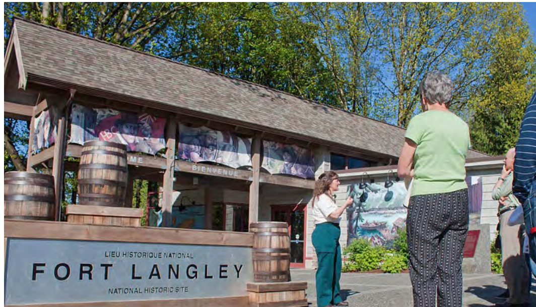
Des visiteurs à l'extérieur du Centre d'accueil, Parc Canada/N. Hildebrand 2011