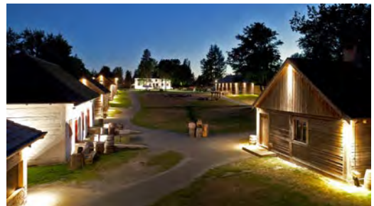
Le LHNC du Fort-Langley la nuit

des visiteurs et d'éducation du public au lieu historique national du Canada du Fort-Langley.