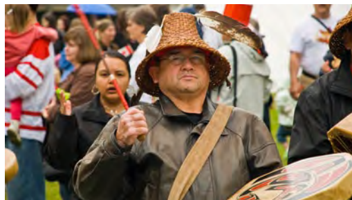
Joueur de tambour Kwantlen menant la procession à la fête du Canada Parcs Canada

Enfin, le plan directeur comporte une stratégie d'application en cinq ans, qui décrit les cibles précises et les mesures correspondant à chacune des trois stratégies maîtresses et des démarches de gestion sectorielle. Il sert en fait de fondement au processus décisionnel et à la reddition de comptes à l'égard du lieu. La pertinence et l'efficacité de cette stratégie pour la gestion du LHNC du Fort-Langley seront revues dans dix ans.