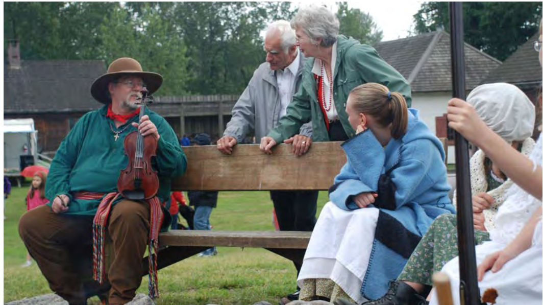
Parcs Canada/N. Hildebrand 2010