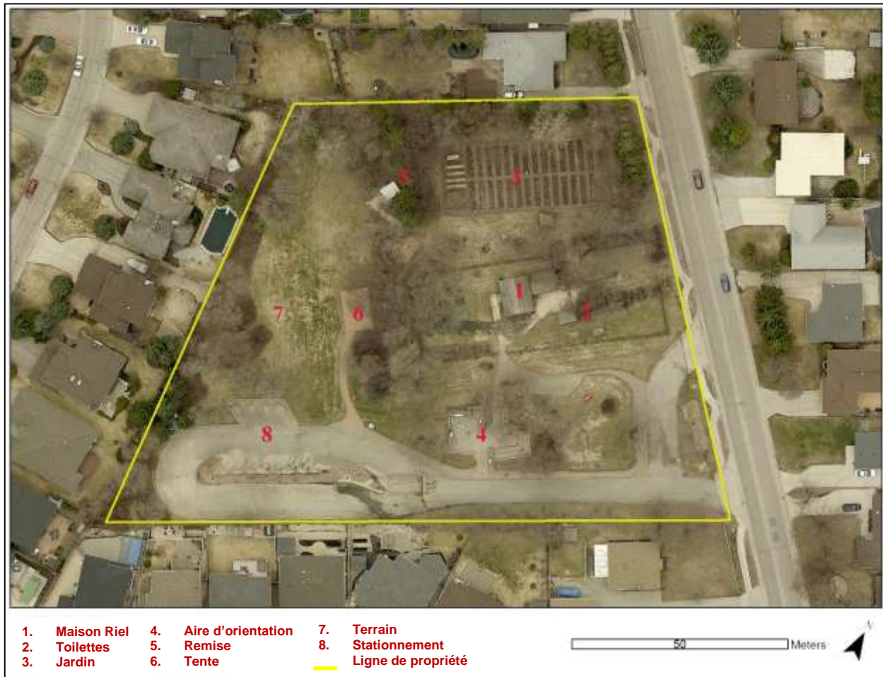
Carte 2. Plan du lieu historique national de la Maison-Riel