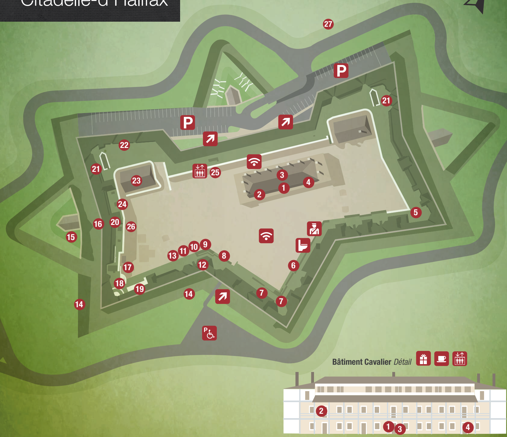
Bâtiment Cavalier Détail