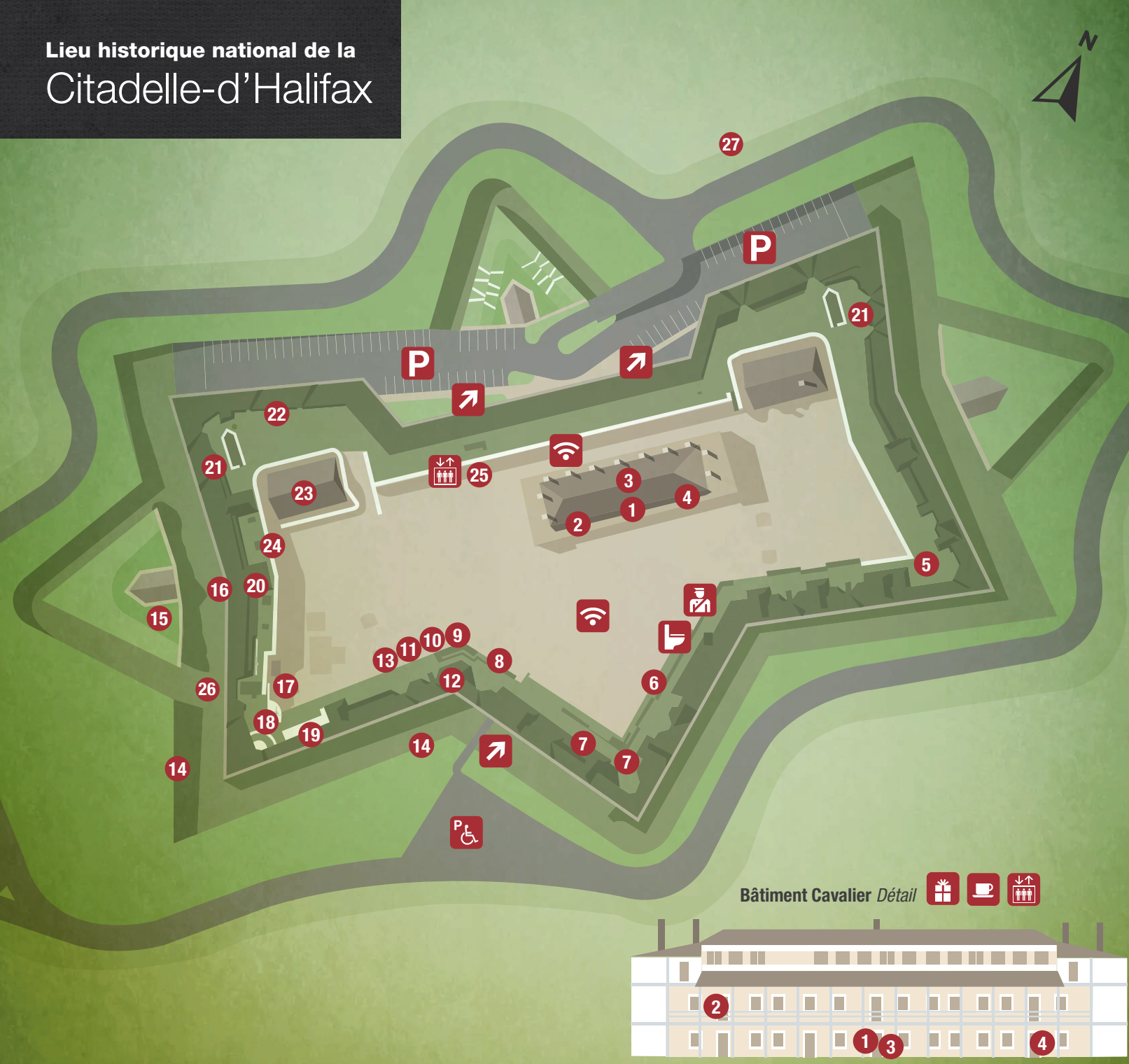
Bâtiment Cavalier Détail