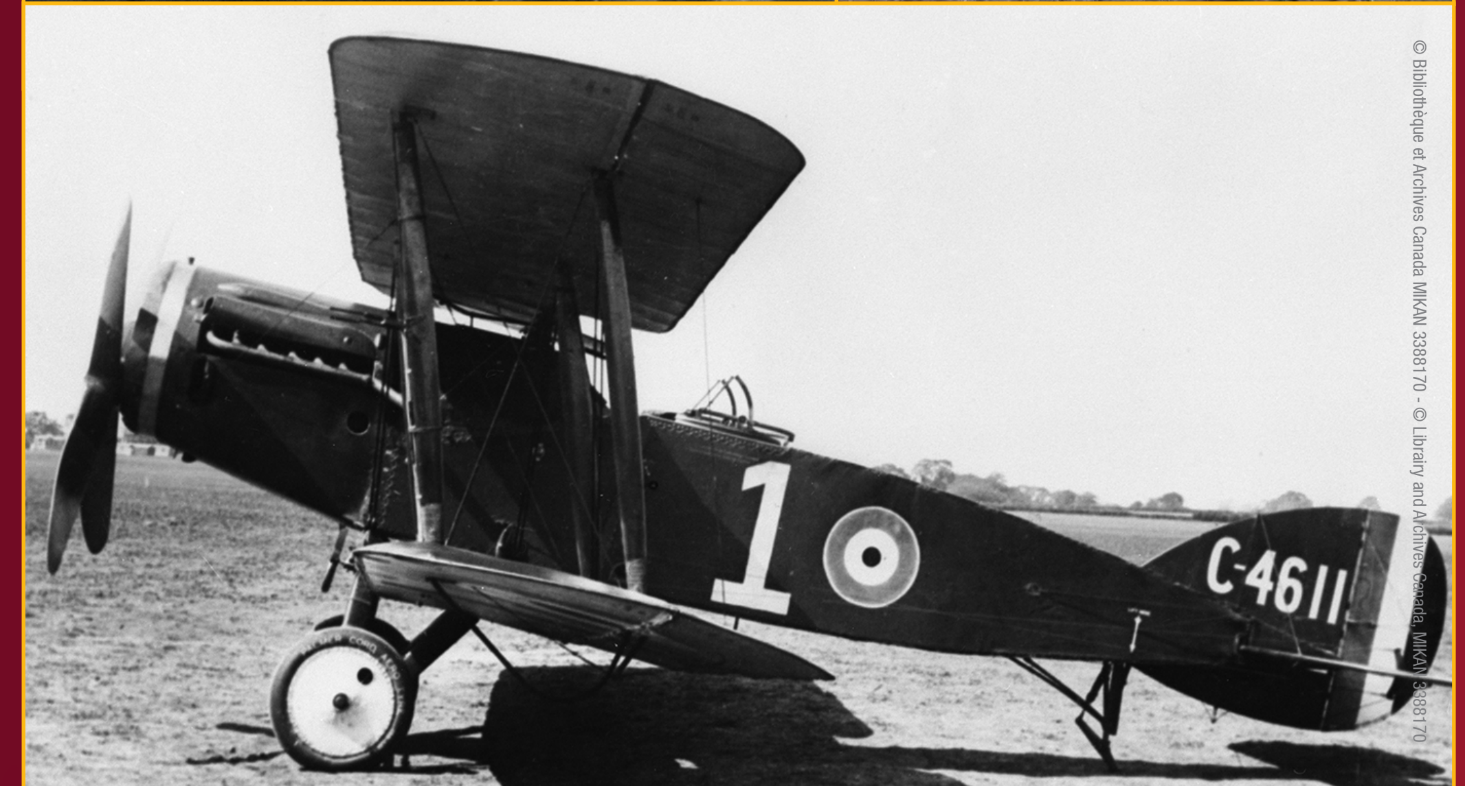
À partir du coin supérieur gauche : Le sous-lieutenant A.W. MacHardy / Site de fouille archéologique de l'avion de MacHardy à Martinsart, Froidchapelle, en Belgique, en mai 2018 / Avion de chasse Bristol F2B du Royal Flying Corps, vers 1917, semblable à celui que pilotait MacHardy.