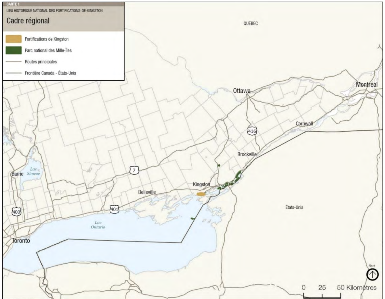
Carte 1 : Cadre régional