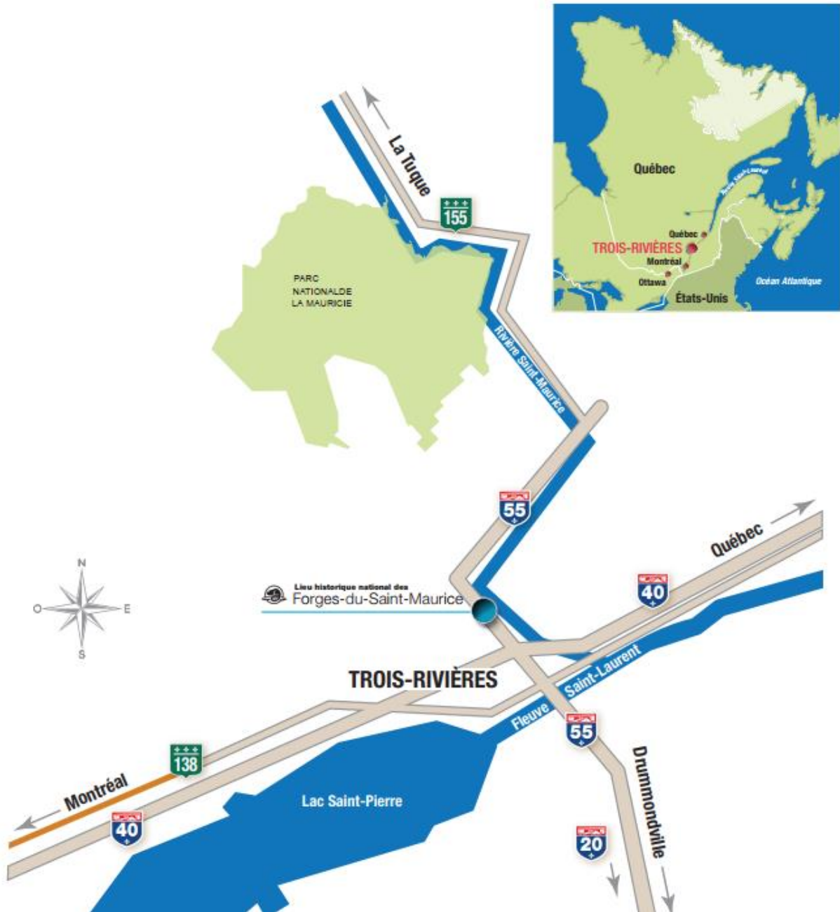
Carte 1 : Cadre régional