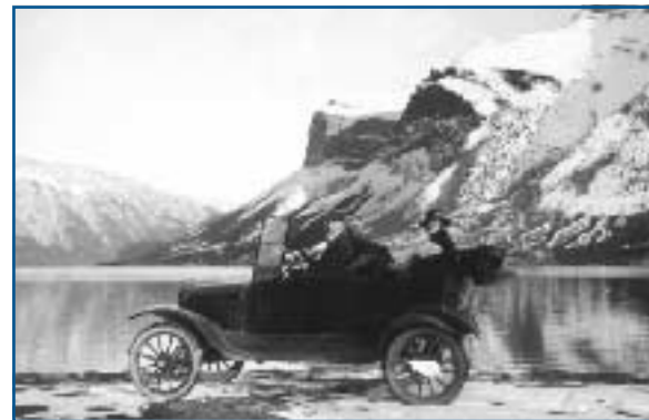
Voiture sur la route Banff/Minnewanka, 1920

Attention : réserver les zones plus profondes aux plongeurs d'expérience. Pour aller d'une jetée à l'autre, les plongeurs doivent traverser des eaux plus profondes : il faut assurer un bon contrôle de la flottabilité pour éviter de descendre plus en profondeur.