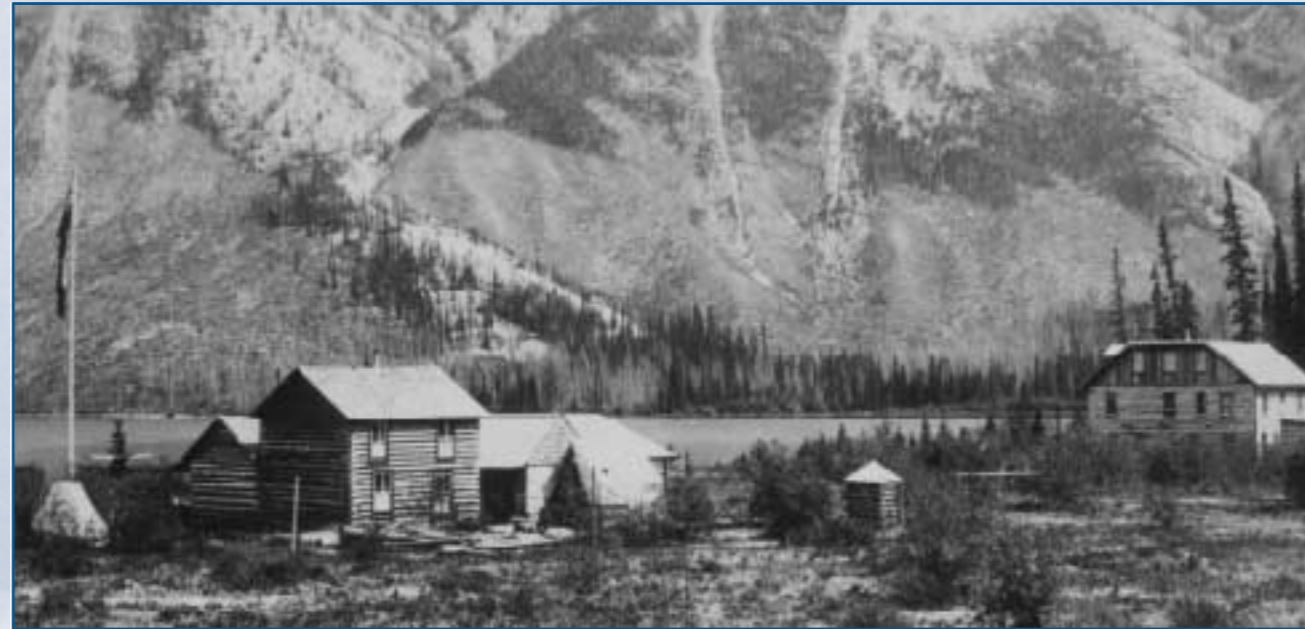
« Hôtels » - Lac Minnewanka, 1890

Le lac Minnewanka a une histoire riche. Il existe des sites archéologiques témoignant d'occupations antérieures aux premiers contacts européens, qui couvrent une période de 10 000 ans. On a trouvé des artefacts remontant à différentes périodes pré-européennes. Le lotissement urbain du lac Minnewanka fait partie de ces sites très anciens dans la vallée inférieure de la rivière Bow. Il existe également des sites historiques comme l'usine hydroélectrique de la vieille cascade et les sites engloutis du lotissement urbain du lac Minnewanka : Minnewanka Landing.