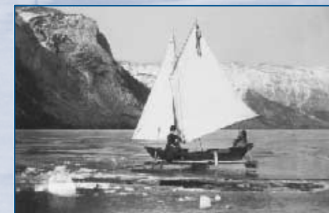
Bateau à glace sur le lac Minnewanka, 1890

Aidez-nous à protéger cette ressource en causant le moins de tort possible et en signalant les cas de vandalisme au service des gardes de parc (1-888-9273367 - sans frais).