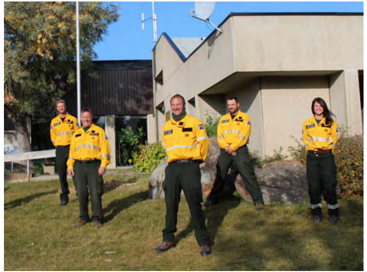
L'équipe d'attaque initiale de Parcs Canada qui a été déployée en Oregon.

Sept employés du parc ont été affectés à cette intervention d'urgence. La plupart se sont joints à une équipe de 20 personnes de Parcs Canada, un autre a participé aux opérations en hélicoptère, et un dernier a pris la direction d'un groupe d'intervention. Pour participer à cet effort, nos spécialistes ont suivi de rigoureux protocoles liés à la COVID-19 pendant leur séjour aux États-Unis, et ils ont observé une quarantaine de deux semaines à leur retour au Canada.