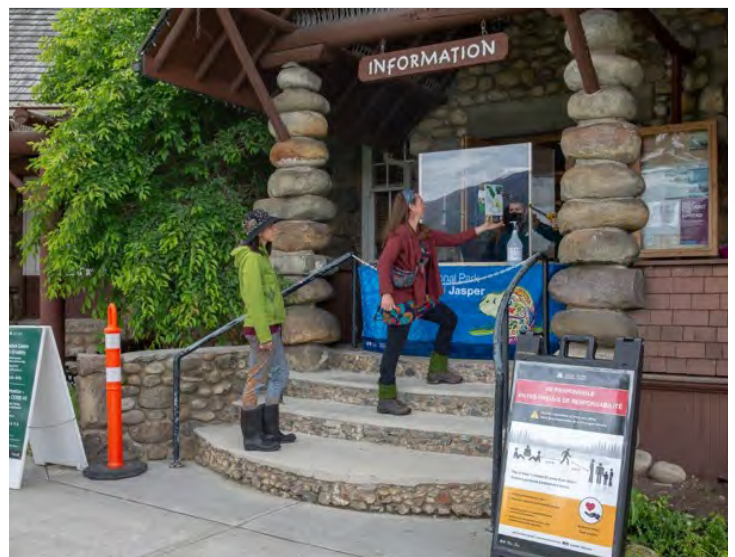
Service offert dans le porche du Centre d'accueil.