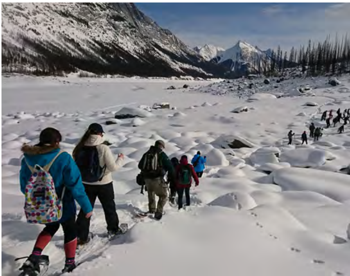
Des élèves en raquettes au lac Medicine avant la pandémie.

Les restrictions liées à la COVID-19 empêchant les élèves de participer à des sorties sur le terrain, le Centre des Palissades a communiqué avec les écoles et a offert des programmes en ligne. Il existe actuellement neuf programmes pour les enseignants et les élèves de la maternelle à la 12 e année, et d'autres sont en voie d'élaboration.