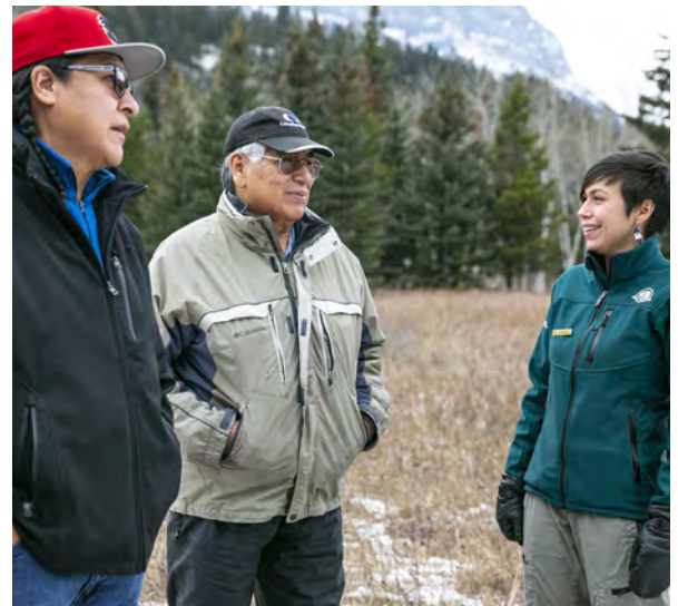
Des partenaires autochtones et un employé de Parcs Canada s'entretiennent au cours d'une rencontre d'un groupe de travail qui s'est tenue avant la pandémie; photo Parcs Canada, N. Gaboury