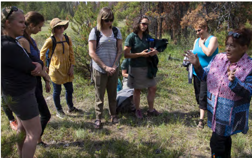
Un partenaire autochtone discute avec des membres du personnel de la façon dont les Autochtones font usage des plantes, et ce avant la pandémie

Pour remédier à plusieurs problèmes systémiques qui remontent à la création du réseau de parcs nationaux, il importe que les Autochtones renouent avec leur territoire. Tout au long de 2020, les partenaires autochtones ont organisé des activités de ressourcement, des cérémonies et des sorties récréatives dans le parc. L'aire culturelle est demeurée un important carrefour pour des rencontres, l'établissement de campements et l'organisation d'activités spirituelles et communautaires. Les partenaires y ont tenu huit événements pendant l'été et l'automne.