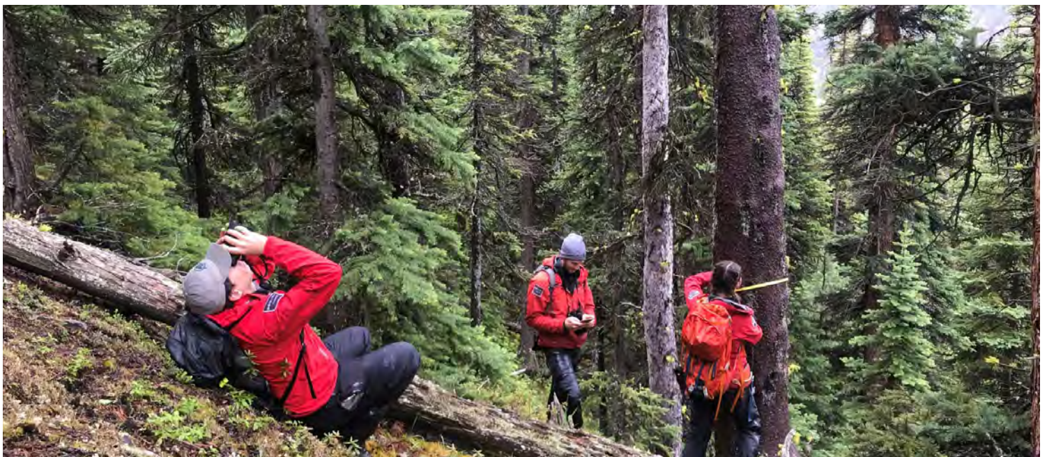
Surveillance du pin à écorce blanche.

Cette année, 800 semis de pins à écorce blanche ont été plantés dans le parc provincial du Mont-Robson grâce à un partenariat qui permet au parc national Jasper et au gouvernement de la Colombie-Britannique de collaborer au rétablissement de cette importante espèce en voie de disparition. De plus, 2 400 semis ont été plantés dans le secteur du mont Edith Cavell.