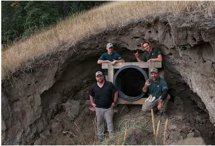
Protection de la petite chauve-souris brune.

La voie d'accès à un lieu d'hivernage important pour la petite chauve-souris brune, la mine Bedson, s'érodait rapidement et risquait de s'effondrer, menaçant de prendre au piège et de tuer la colonie de ce petit mammifère en voie de disparition. Un ponton a été installé à l'ouverture de la mine pour la protéger.