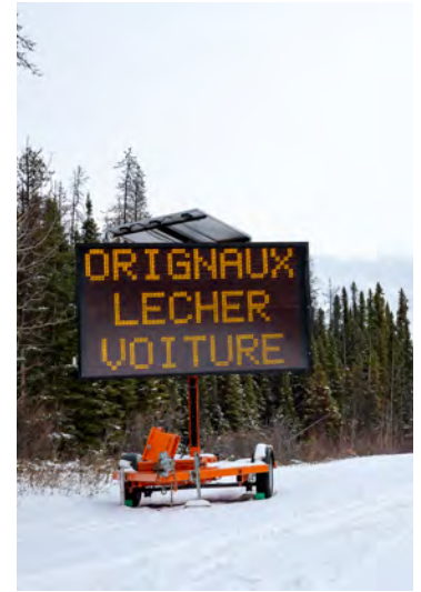
Message électronique viral « Ne laissez pas les orignaux lécher votre véhicule ».