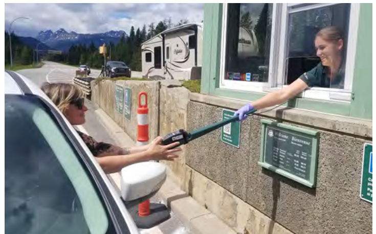
Accueil des visiteurs et éloignement physique.

Sur son site Web, le parc a fait savoir aux visiteurs ce à quoi ils devaient s'attendre pendant la pandémie. Le personnel a aussi érigé plus de 160 panneaux de sécurité dans tout le parc afin de rappeler aux visiteurs leurs responsabilités quant à l'éloignement physique et à la désinfection.