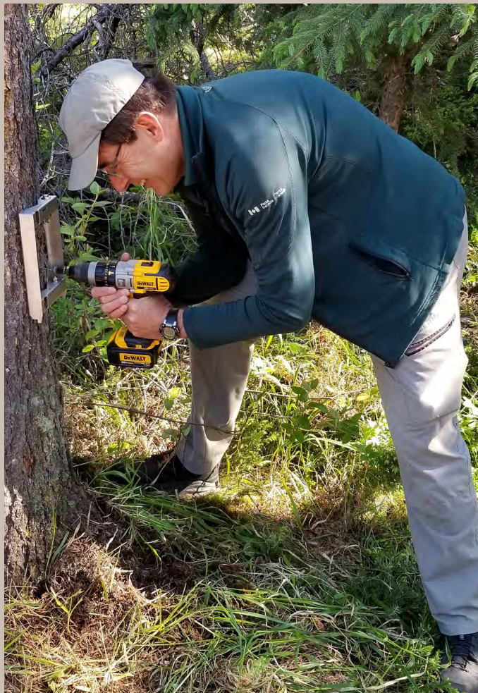
Installation d'un compteur de circulation.

Il s'agit de l'investissement le plus important dans les campings du parc depuis les années 1960 et de l'un des plus grands investissements dans l'infrastructure nationale de camping de Parcs Canada.