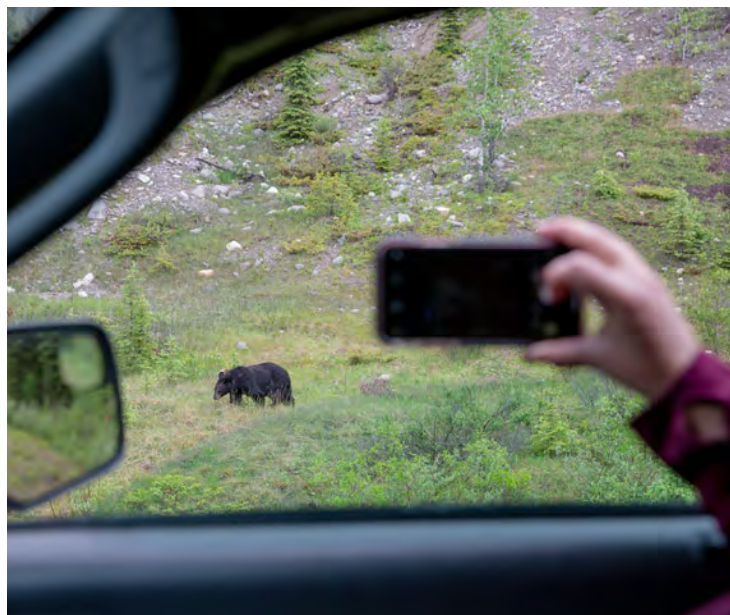
Observation sécuritaire de la faune.

Les équipes mobiles de vérification de la conformité ont été en fonction 7 jours sur 7 et ont interagi avec plus de 100 000 visiteurs. En 2020, les problèmes communs concernaient surtout le stationnement et la congestion aux principales plages et aires de fréquentation diurne, le rangement inapproprié des provisions ou des ordures et le camping illégal.