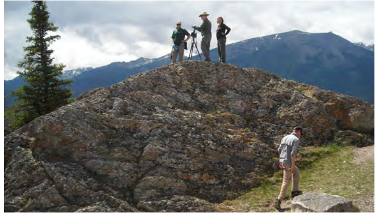
Création d'une station de photos répétées sur la colline Old Fort Point en 2019.

L'équipe du Mountain Legacy Project de l'Université de Victoria a pris de nouvelles photos à certains des endroits que l'arpenteur M. P. Bridgland avait immortalisés en 1915. Ces « photos répétées » témoignent des changements spectaculaires qu'a subis le paysage sous l'action des processus naturels (comme le dendroctone du pin ponderosa) et de l'activité humaine. Les chercheurs ont réalisé une première série de photos répétées en 1999 et une deuxième série en 2019. Cette année, Parcs Canada a remis au goût du jour les photos originales sur plaque de verre que M. P. Bridgland avait produites dans le parc national Jasper en les numérisant à haute résolution. Ces photos historiques numérisées fournissent plus de détails et de clarté et permettent une meilleure comparaison avec les photos répétées prises par les membres du Mountain Legacy Project en 1999 et en 2019.