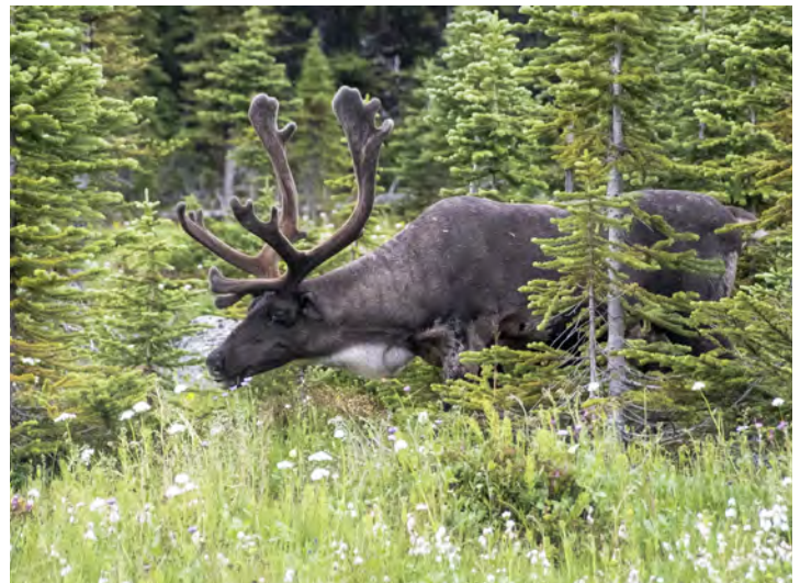
Caribou des montagnes du Sud, parc national Jasper.

Comme suite aux engagements contenus dans le Plan d'action visant des espèces multiples dans le parc national du Canada Jasper , Parcs Canada a élaboré une proposition de programme d'élevage de conservation afin d'augmenter l'effectif des populations. La proposition est fondée sur les meilleures données scientifiques obtenues à l'issue de décennies de travaux de surveillance et de recherche par des biologistes et sur les avis d'un vaste éventail d'experts en conservation du caribou. Avant toute décision, la proposition fera l'objet d'un examen exhaustif par un groupe d'experts externes. Détails : parcsCanada.ca/caribou-jasper