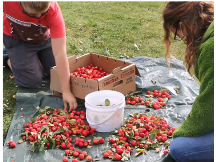
Transformation de pommettes.

Parcs Canada a participé à des activités de diffusion externe et à des événements communautaires comme le festival Deep Freeze à Edmonton et la Journée de sensibilisation aux avalanches à la station de ski Marmot Basin. En septembre, le personnel de la Conservation des ressources du parc, l'école primaire Desrochers de Jasper et la Jasper Local Food Society ont collaboré à un projet d'intendance communautaire. Les élèves ont cueilli des pommes dans des jardins de Jasper et en ont fait du jus et de la compote; cette initiative a favorisé l'adoption de pratiques sécuritaires au pays des ours, la durabilité alimentaire et l'intendance environnementale.