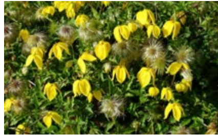
Clématite tangoute ( Clematis tangutica )