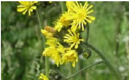
Épervière des prés ( Hieracium pretense )