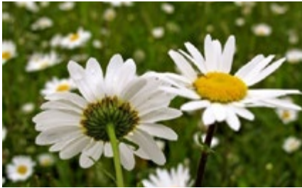
Marguerite blanche ( Chrysanthemum leucanthemum )