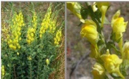
Linaire à feuilles larges ( Linaria dalmatica )