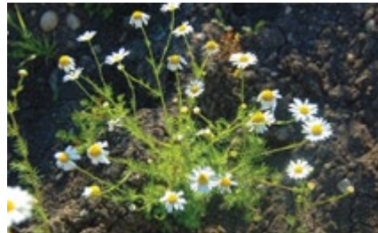
Matricaire inodore ( Matricaria perforate )