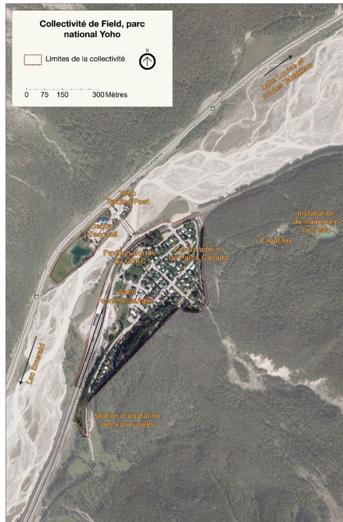
Carte 1. Carte des activités et des installations périphériques