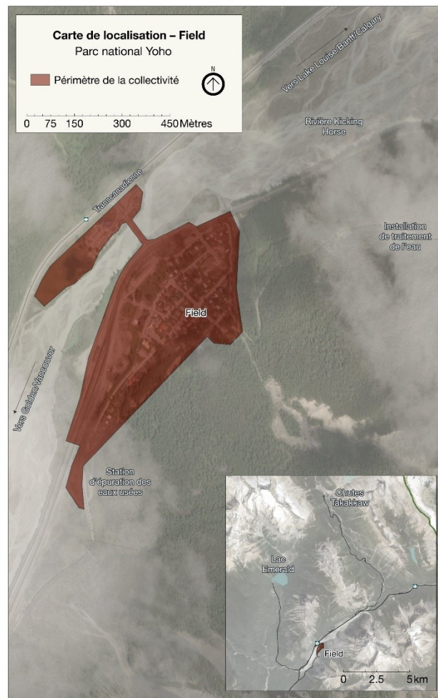
Carte 2. Carte de localisation de Field

La collectivité de Field se trouve à 15 km à l'ouest de la frontière entre la Colombie-Britannique et l'Alberta et à 26 km à l'ouest de Lake Louise, en Alberta. Le village de Golden, en Colombie-Britannique, est situé à 58 km à l'ouest. Pour les résidents de Field, il s'agit du centre le plus rapproché pour l'obtention de soins médicaux, de produits d'épicerie et de fournitures essentielles du quotidien. C'est également à Golden que les enfants de Field vont à l'école.