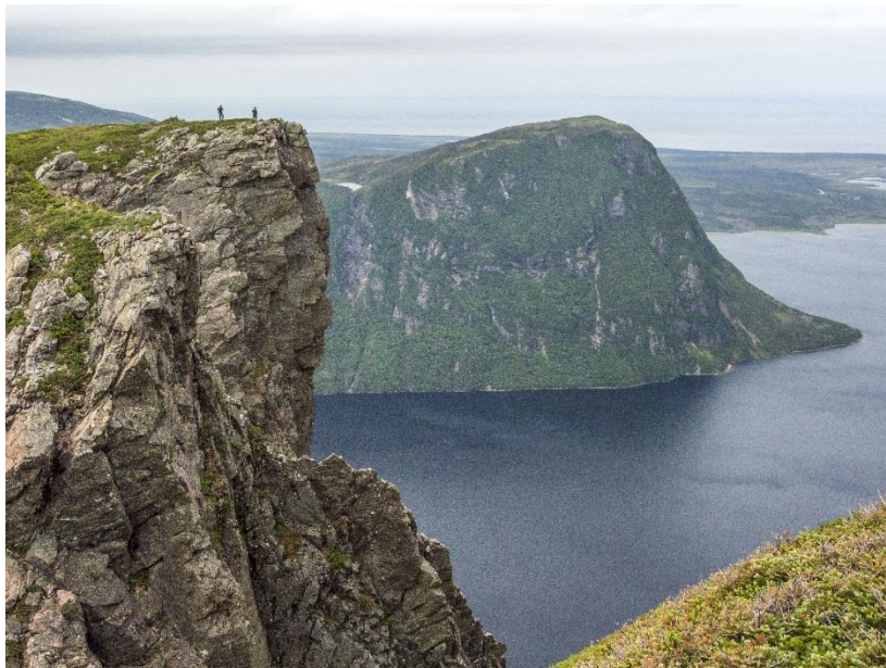
North Rim, S. Stone