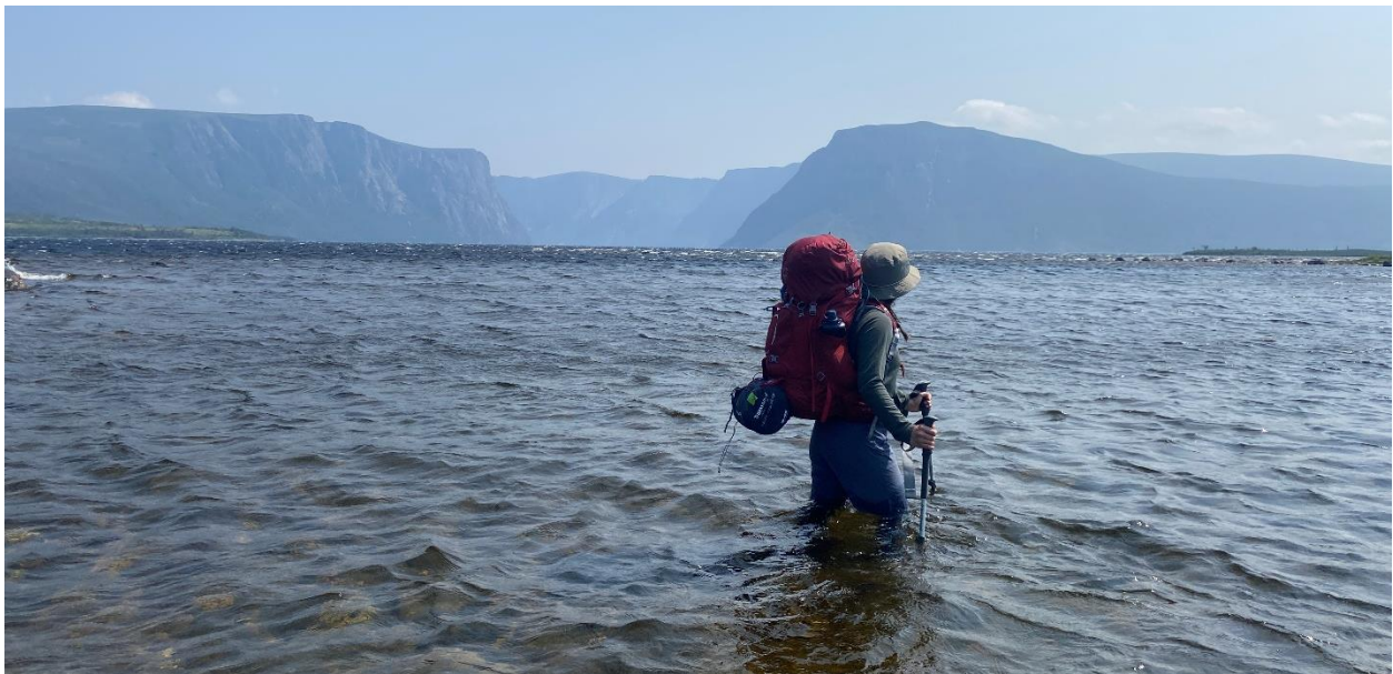
Traversée à gué du ruisseau Western

Le parcours qui sépare le ravin Ferry de l'étang Bakeapple est accessible par le sentier au sommet du Gros-Morne. Pour protéger la faune durant ces semaines cruciales de croissance et de reproduction, ce sentier est interdit aux randonneurs du 1 er mai et rouverte le 28 juin.