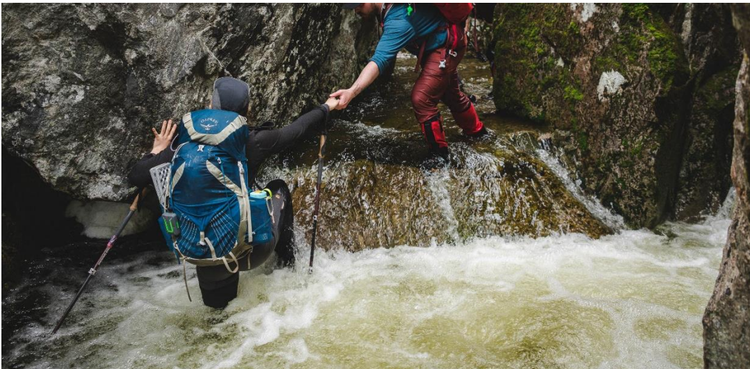
Niveau d'eau élevé dans la gorge de Western Brook Pond.