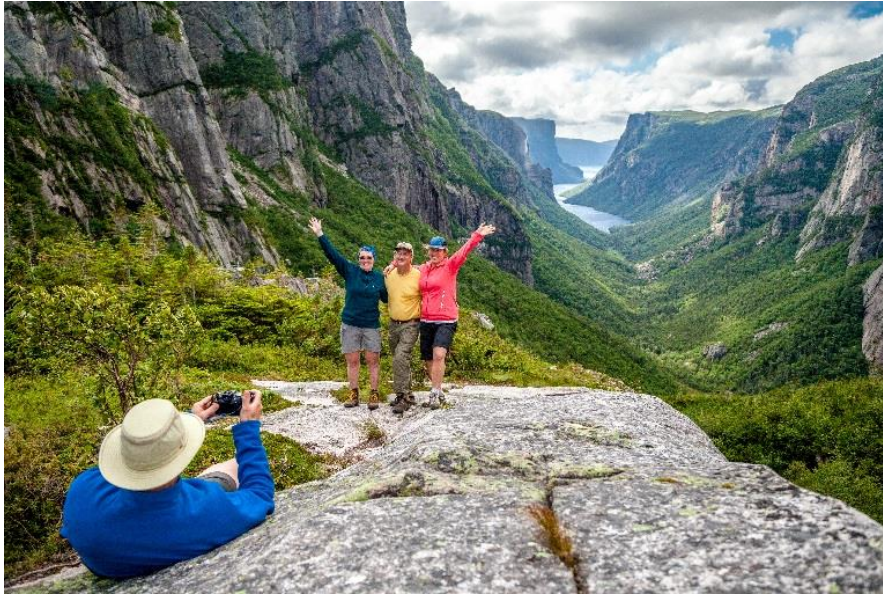
La gorge de l'étang Western Brook