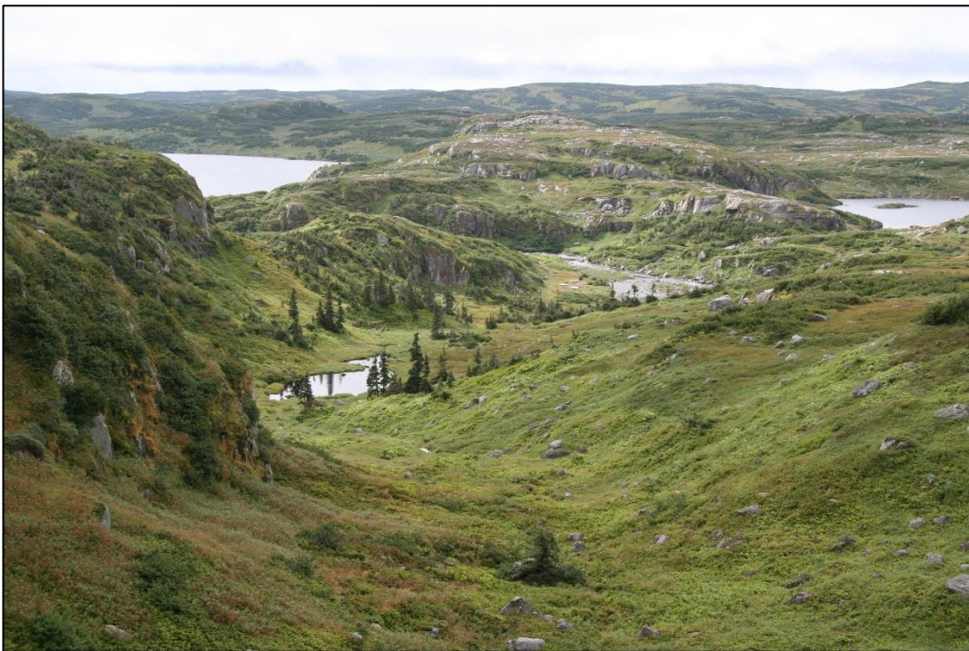
Dominant de 800 m les tourbières du golfe du Saint-Laurent, les vénérables monts Long Range marquent l'extrémité nord de la chaîne des Appalaches. Dans leurs tourbières et leurs landes arctiques-alpines vivent des caribous, des orignaux, des lièvres arctiques et des ours noirs.

Les monts Long Range offrent aux randonneurs l'un des terrains les plus pittoresques et les plus difficiles de l'est de l'Amérique du Nord. La randonnée dans les monts Long Range représente un défi à la fois physique et psychologique. Le site est éloigné, ardu et potentiellement dangereux. Il ne compte aucun sentier aménagé à proprement parler, bien que des itinéraires soient suggérés. Toutefois, aucun n'est balisé ou entretenu de quelque manière que ce soit. Ainsi, les randonneurs qui choisissent de s'y aventurer doivent avoir de l'expérience dans l'arrière-pays montagneux, être autonomes et bien savoir lire des cartes et utiliser une boussole et un GPS pour pouvoir s'orienter dans un environnement sauvage et inconnu.