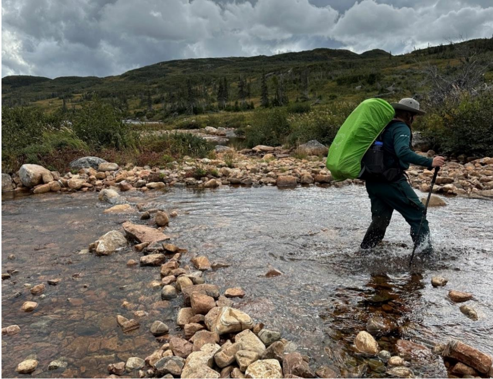
Traversées de cours d'eau près de Marks Pond.