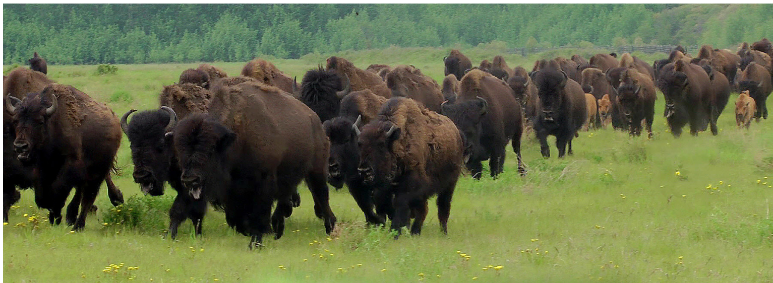
Harde de bisons du parc national Wood Buffalo.