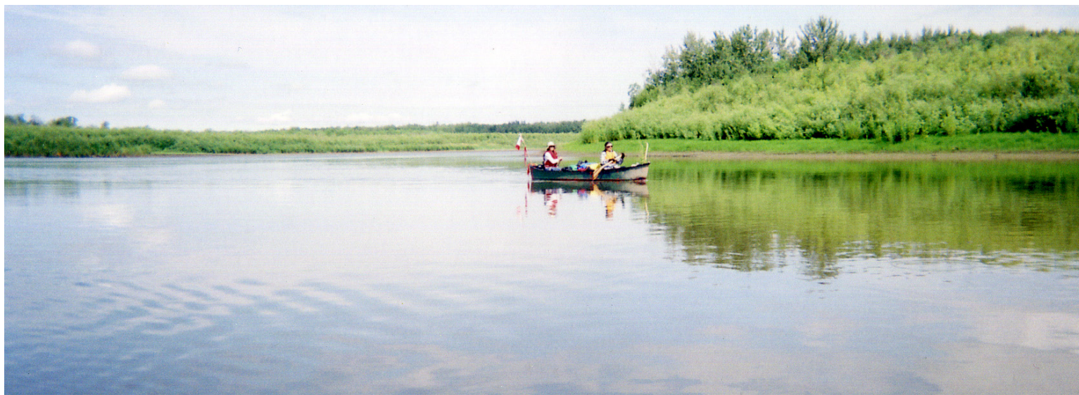
Excursion sur le delta Paix-Athabasca.