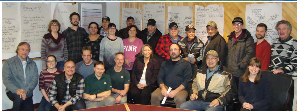
Photo de groupe avec la Première Nation crie Mikisew au sortir de l'atelier sur l'évaluation environnementale stratégique.