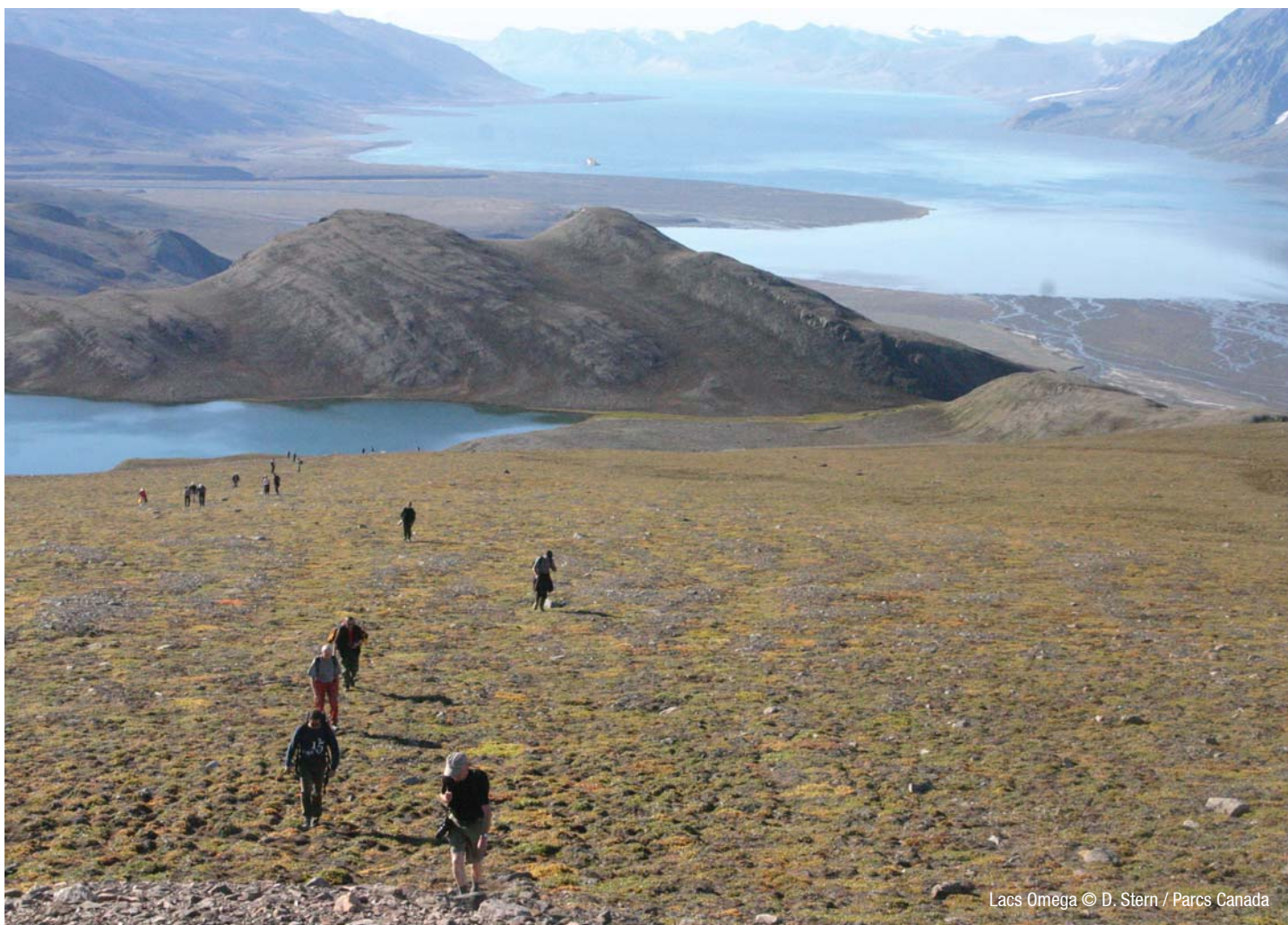
Lacs Omega

Les randonneurs peuvent explorer le parc à partir de la station du fjord Tanquary. Les visites à l'historique Fort Conger sont possibles sur permission spéciale et nécessiteront qu'un employé de Parcs Canada accompagne votre groupe.