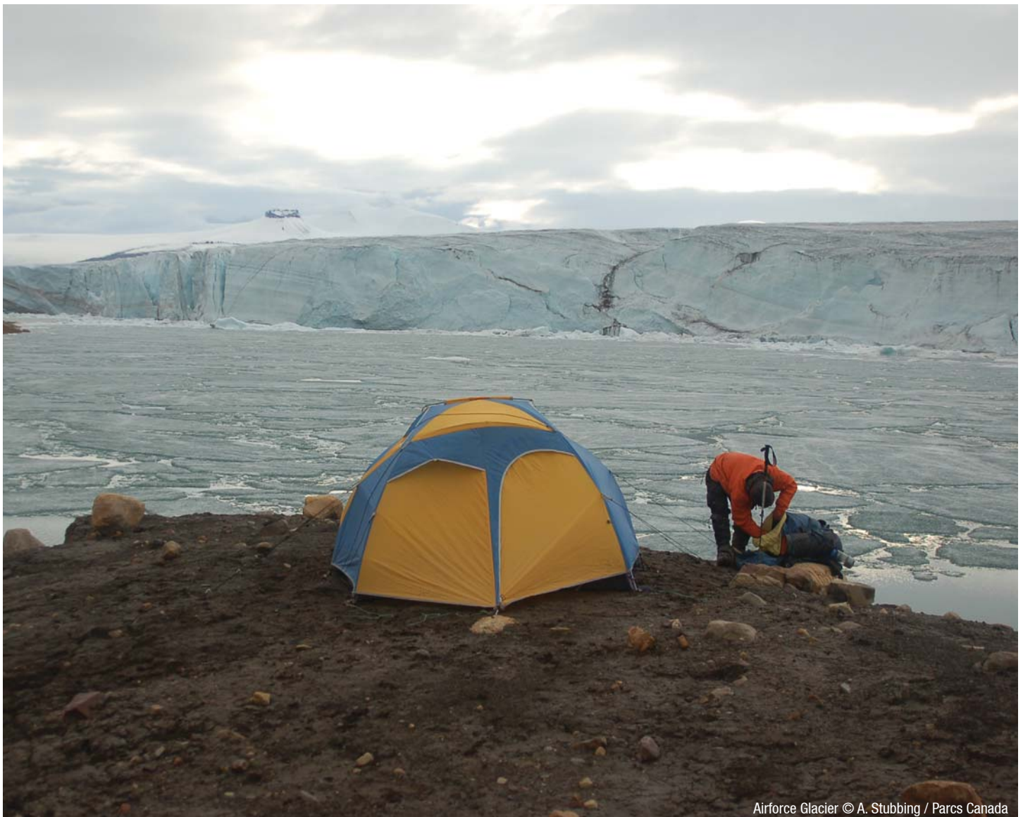
Airforce Glacier

Ce sont les frais au moment d'aller sous presse.