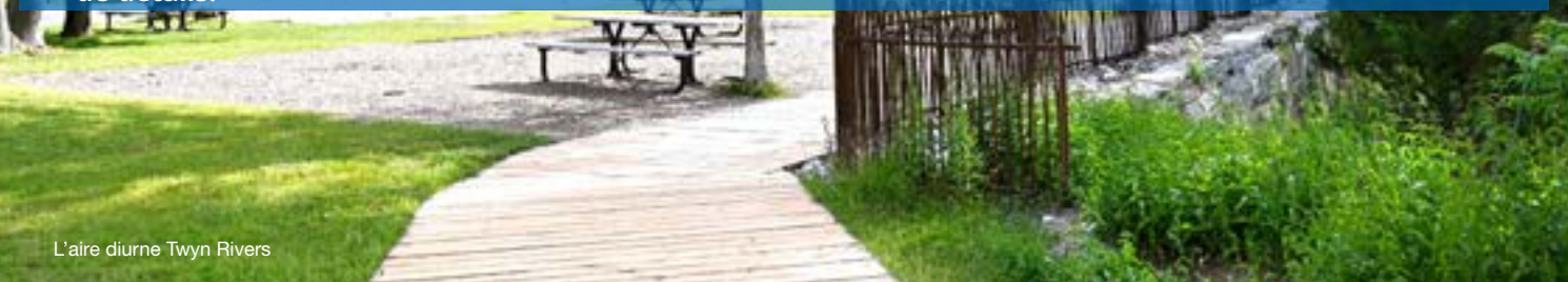
L'aire diurne Twyn Rivers

*Les vélos sont autorisés uniquement sur les sentiers désignés; voir Descriptions des sentiers pour plus de détails.