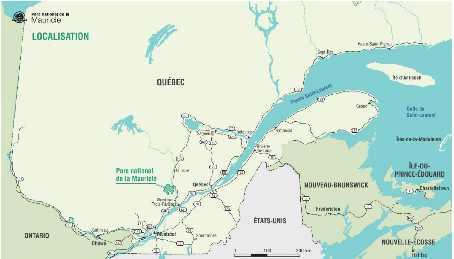
Carte 1 : Cadre régional