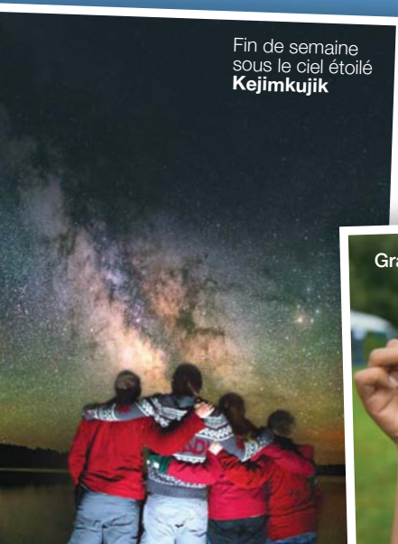
Fin de semaine sous le ciel étoilé Kejimkujik