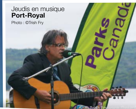
Jeudis en musique Port-Royal