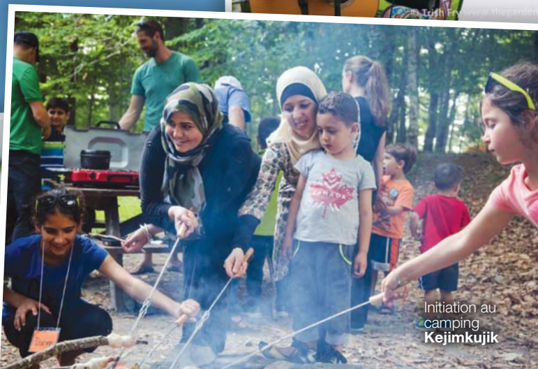
Initiation au camping Kejimkujik