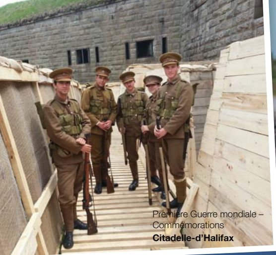
Première Guerre mondiale – Commemorations Citadelle-d'Halifax